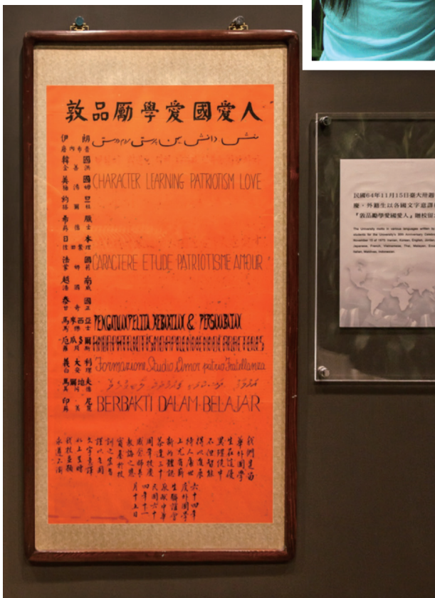
(畫心尺寸：130.5高、67寬公分)

原件褪色嚴重，獲得墨寶之初，校史館只要遇到外籍師生與訪賓來到校史館，即請求協助辨字，陸續獲得幾個華人世界較不熟悉的校訓外文翻譯：