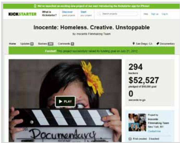
Inocente紀錄片在Kickstarter平台上提案募資的網頁。