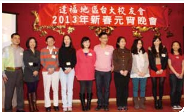
今年新加入校友會的新人合影。