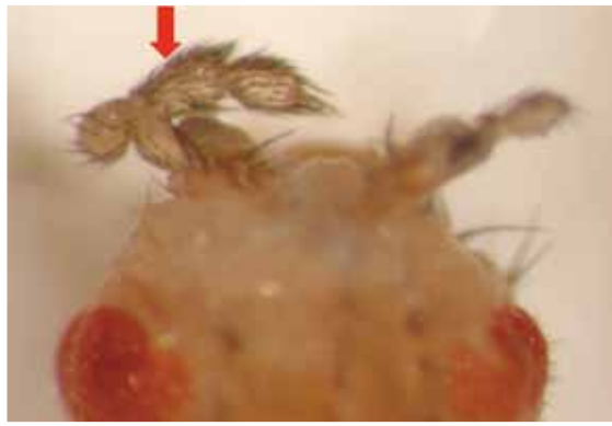
研究人類智能不足的致病基因時，意外發現失去該智能不足致病基因後，果蠅觸角長成前腳的樣子（箭頭所示）。

種在演化上擁有共同的起源，無論各物種之間在形態上有多大差異，動物的基本生存原則、繁殖原則以及代謝原則等，在不同物種間仍然存在高度的相似性，且彼此之間的差別也有脈絡可尋。儘管人類和果蠅外觀初看是那麼不同，但有些內臟的構造功能卻十分類似。舉消化器官做一個簡單的例子，小腸是人類吸收食物養分的器官，其中的上皮組織包括3種細胞：占大多數的吸收上皮細胞、占少數的分泌上皮細胞以及神經內分泌細胞；而果蠅也有小腸，小腸的上皮亦有3種細胞分別負責吸收、分泌以及神經內分泌功能，這在其他種類的昆蟲、節肢動物也是如此。果蠅跟人類的小腸會如此相像並非巧合，在演化過程中，人類和果蠅很早就分開演化，如同兩個分家後各自獨立發展的脈絡。但是某些分家之前就已經發展完善，而且很好用的東西像是消化道，在分家之後人類和果蠅各自發展的脈絡都被完整保留，並且一代傳給一代，其中差別只在於人類的器官可能構造更複雜些。就小腸主要的吸收功能而論，果蠅好比是人類的小表弟，是秉持著一模一樣的設計理念而生產出的兩種產品。我們稱這種在演化過程中，分家後仍各自保留相同的好東西之原則為「演化的保留」。