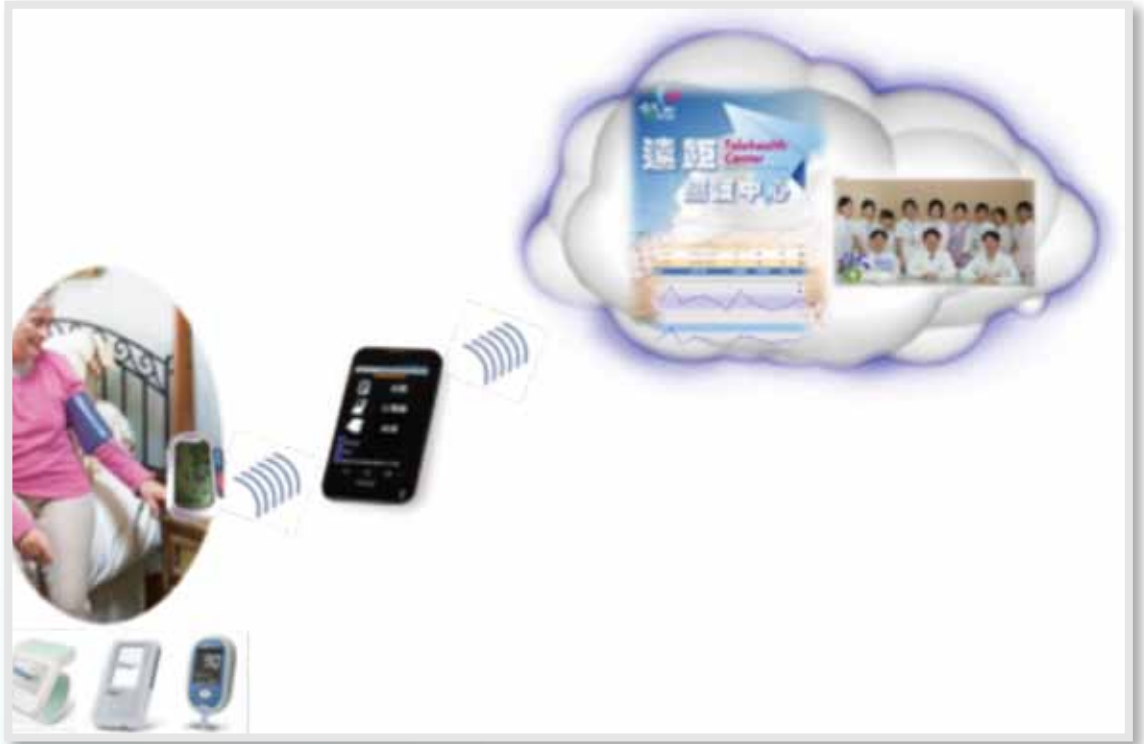
圖2：雲端隨身護理師照護情境

鍵（圖3左）量測後即「自動連線、自動上傳」，友善直覺式的操作將大幅提升大眾的使用意願，並且結合歷史紀錄功能（圖3右）完整呈現個人長期身體健康狀況。