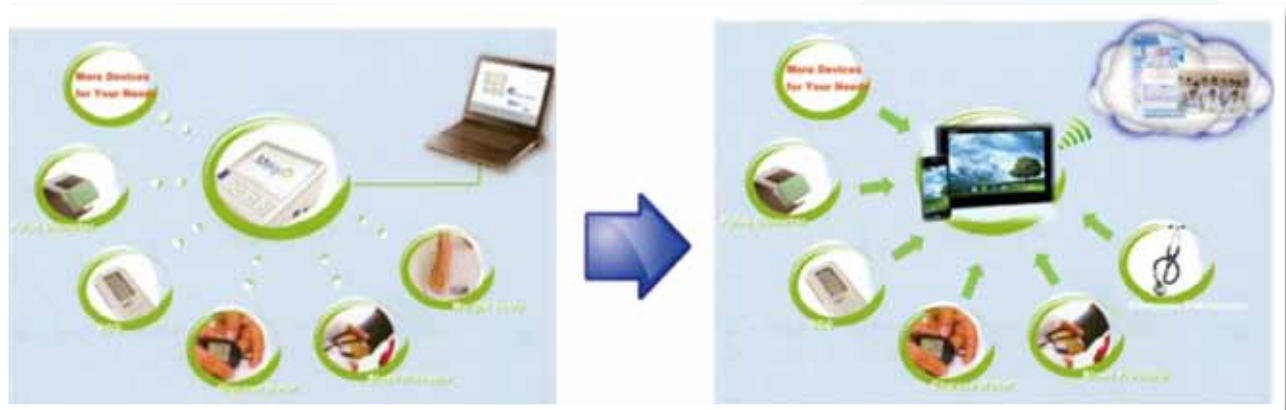
圖1：現行臺大醫院遠距照護系統→臺大醫院雲端隨身護理師

為改善此一問題，本研究團隊（電機系呂學士教授與臨床醫學研究所何奕倫副教授主持）設計出遠距之監測醫聯網——「雲端隨身護理師」（圖1右），讓所有人能夠在任何地點、任何時間使用手機或平板電腦作為個人健康管理中心，並且通過隨身網路（GPRS/3G/4G）或Wi-Fi將個人的健康資訊立即儲存匯整至醫療雲端。