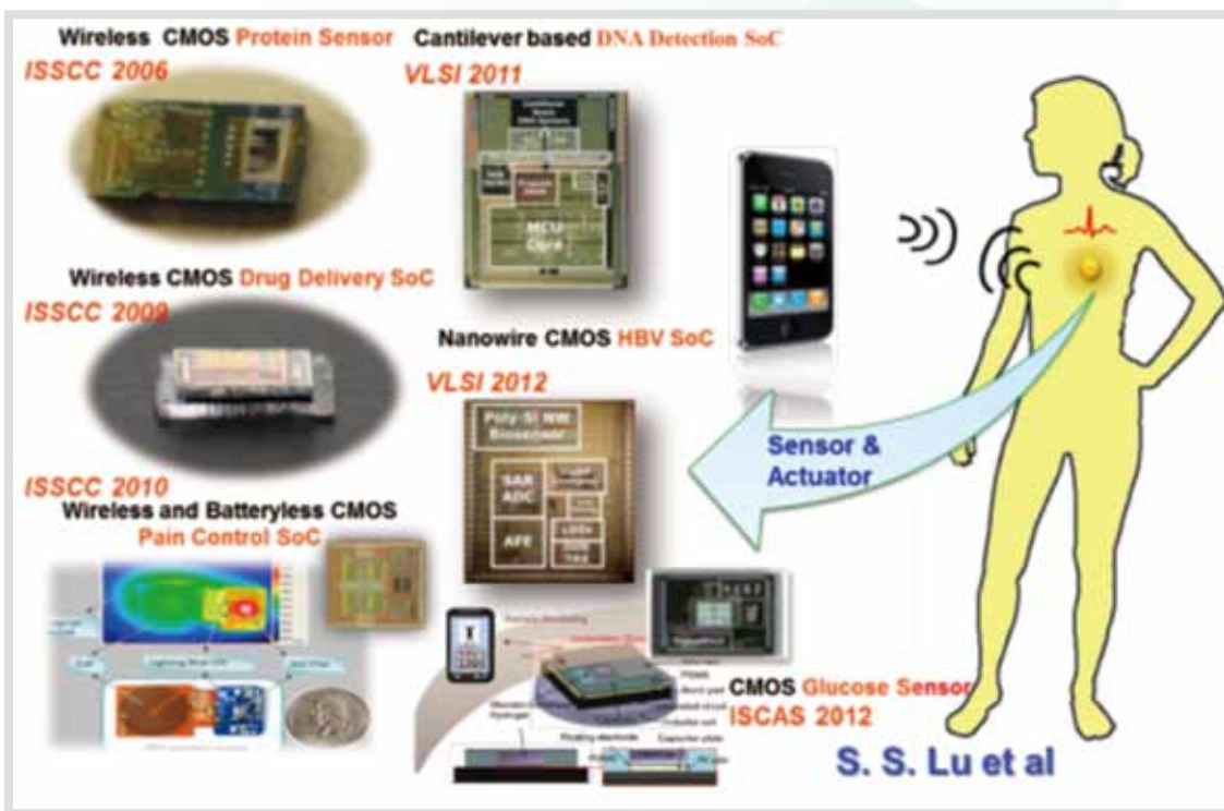
圖5：研究成果Off-In-On the body

晶片 [4] 。人體相互接觸即可傳遞資訊 [5] 便是On the body的應用。In the body則完成微型化可植入的無線生醫感測器，患者或醫護人員更可透過所開發之植入式釋藥元件 [6] 做第一時間的即時醫治，或是利用電刺激達到減緩疼痛的效果 [7] 。圖5（本期專欄策畫／醫學檢驗暨生物技術學系方偉宏教授&健康政策與管理研究所鄭雅文教授&電機系簡韶逸教授）