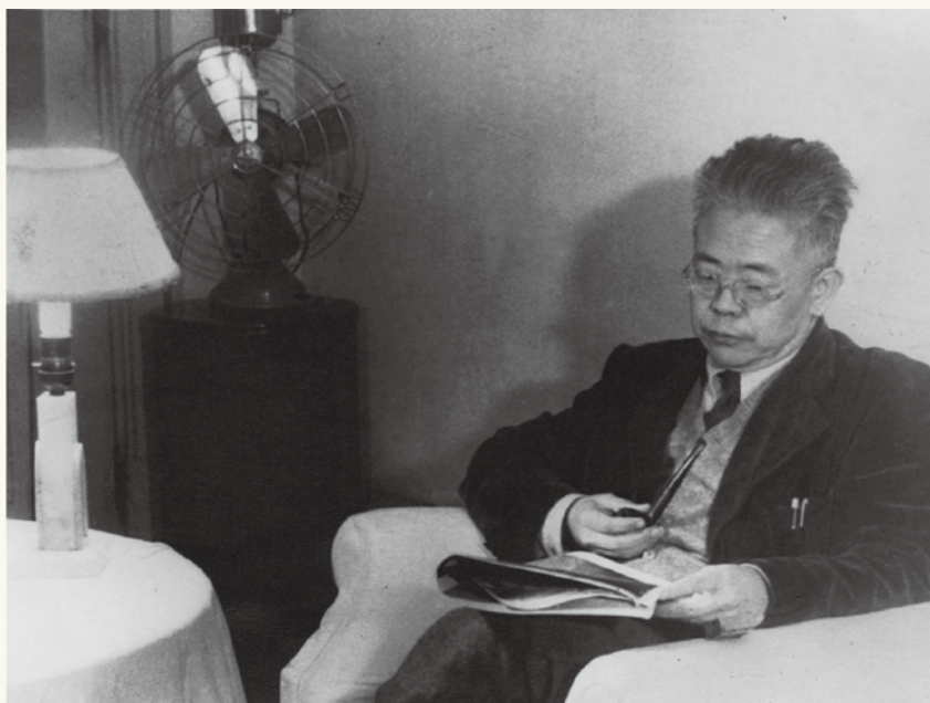
傅斯年校長攝於臺大校長室。

2006年，為了紀念傅校長110歲冥誕，臺大出版中心將他所撰關於臺灣大學的17篇文章集成《臺灣大學辦學理念與策略》出版，引起廣大的迴響。在臺大歡度84年校慶之際，臺大出版中心特別推出《臺