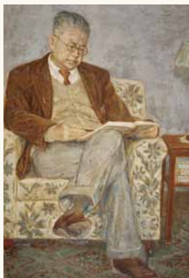
傅斯年校長畫像，李石樵作於1952(民41)年，原件為麻布油畫，藏於國立臺灣大學圖書館。