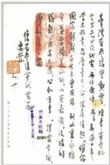
1949(民38)年1月21日傅斯年校長受命為臺大第4任校長後，傅校長親擬回復省參議會電文表達謝意。