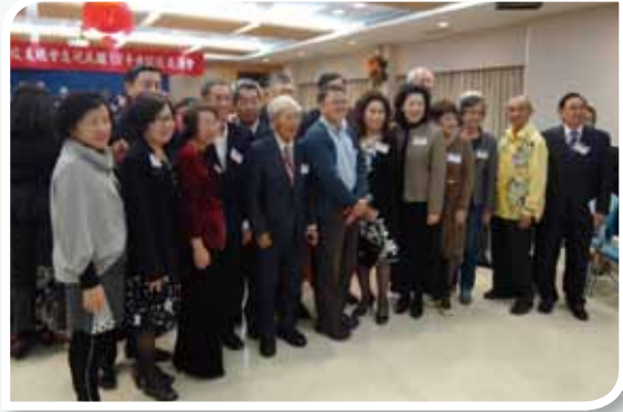
馬來西亞校友會一行23人回臺參加校慶，增添歡樂氣氛。