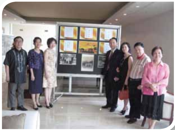
校友們在舊照片前憶年少。