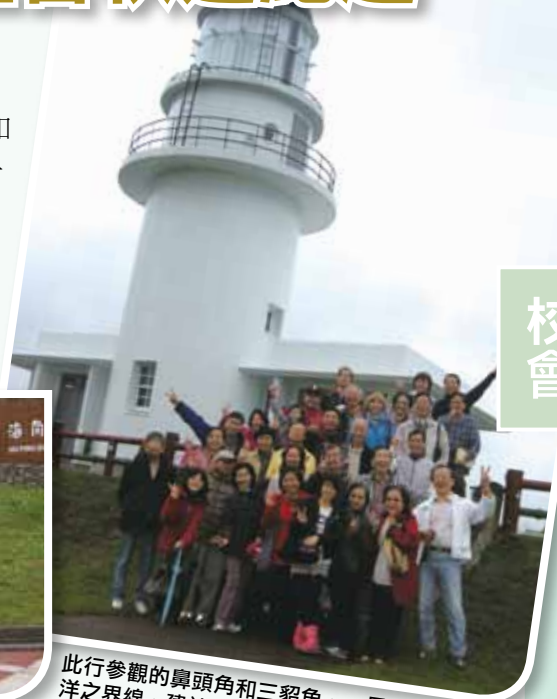
此行參觀的鼻頭角和三貂角，一是東海和太平洋之界線，建於1896年；一在臺灣最東，北臺灣唯一可以入內參觀的燈塔。