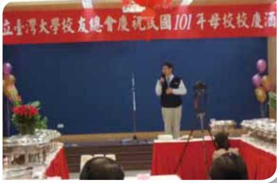
教育部蔣偉寧部長代表校友致詞。