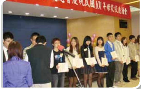
蔣部長代表校友頒發母校各學院優秀學生獎學金。