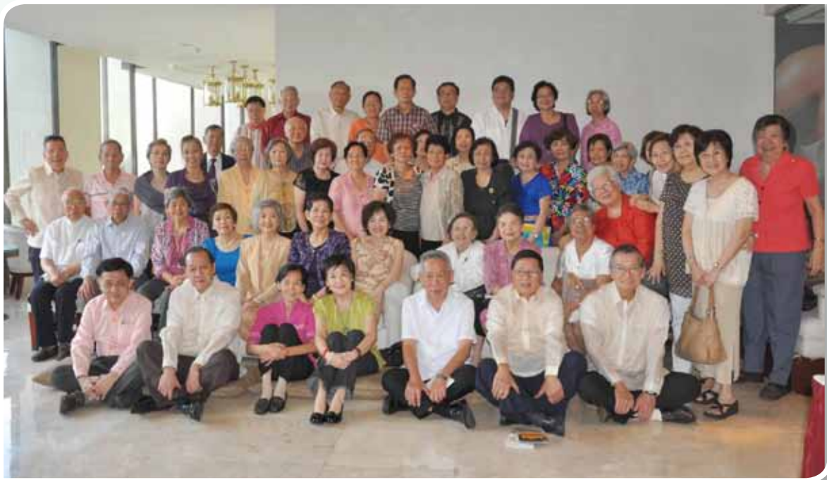
菲律賓臺大校友會成立已半個世紀。超過50位校友同慶這個好日子。