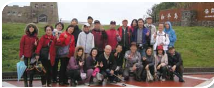
基隆的和平島原為軍事要塞。

臺 大工商聯誼會於11月底舉行秋季郊遊，足跡遍至和平島海角樂園和國立海洋科學博物館（101年9月才開張），以及鼻頭角和三貂角（與富貴角有北臺灣三角之稱）。是日天候不佳但運氣不錯，只要下車賞景，雨就很配合地暫停，海浪因大風洶湧澎湃、氣勢壯觀。