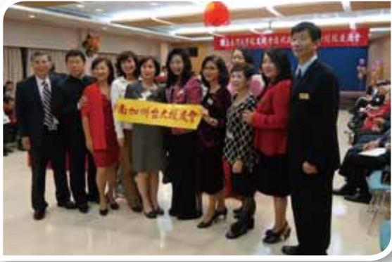
南加大校友會一行14人組團返臺參加校慶。