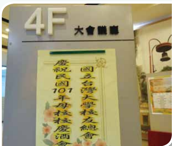
校友會以最誠摯的心歡迎校友們一起祝賀母校84歲生日。