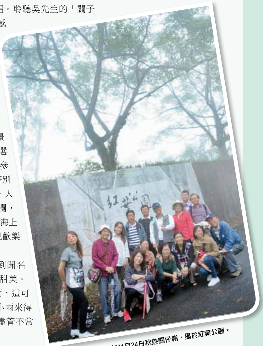
臺中市校友會於101年11月24日秋遊關仔嶺，攝於紅葉公園。

時光飛逝，踏著夕陽餘暉來到聞名遐邇的民雄鵝肉亭，大啖鵝肉的甜美。飯後，夜幕已低垂，天空開始飄雨，這可不是「無邊絲雨細如愁」，而是小雨來得正是時候。我們互道珍重再見，儘管不常聚，然情長亦深。☺