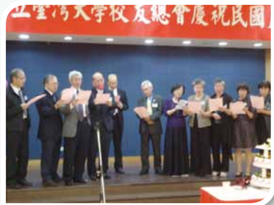
40重聚會學長姐們重拾年輕活力，高唱楊弦譜曲，余宗澤作詞之《黃金歲月》。