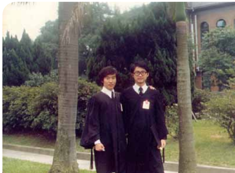
畢業那年在椰林大道留影（右）。

問題有賴學術社群的互動、討論、形成共識，進而影響政府決策。他不諱言，近年來各校都積極進行法學教育的改革，以因應社會的發展和需要，臺大法律學院在全國的法學教育中居於龍頭地位，為了善盡社會責任，他計畫成立全國法學院院長論壇，就法學教育、國家考試、職業訓練等制度，以及其他與法律相關的公共議題或重要法案，經由討論取得共識，並向政府提出改革芻議。舉例而言，目前辦理法官訓練的司法官訓練所屬於法務部，而法務部隸屬行政院，行政和司法體系混淆，顯然違背司法獨立審判的基本理念，他強調，臺灣要成為真正的民主國家，建立獨立的法官考試與訓練制度是第一步。而改進訴訟審理方式，讓訴訟審理更有效率，也是司改極為重要的一個進程。他說，「今年暑假，我去美國華盛頓DC看APPLE和HTC的訴訟，法院全程錄音，隨即以軟體轉換成文字檔，一字不漏地PO上網，完全公開透明。反觀臺灣的法庭審理過程，書記官只是繕打當事人陳述的摘要，而不是全文