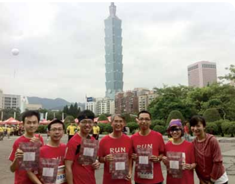
愛上跑步，2012 與學生參加馬拉松路跑。

作為院長，他說，第一要務是提供更優質的行政服務，支持教學與研究向上提升。他希望能營造一個健康快樂的學術環境，在互信基礎上、凝聚向心力，讓每位老師獲得所需的資源與支援，不僅個人得以發揮學術志趣，也能以團隊的力量影響社會。他自許扮演控球後衛的角色，不是像林書豪一樣成為鎂光燈焦點，而是將球送到每一位老師手上，讓每個人都能上籃得分。熱愛運動的他，幾乎每天清晨在校園田徑場赤腳跑步12公里，一年多來已累積2千多公里，足可繞行臺灣兩圈。他豪氣的說體能比學生時代更好了，接下來他要兌現競選政見，帶大家登玉山、騎鐵馬環島，強健體魄，以提高團隊戰力，打造一個讓粉絲頻按讚的臺大法律學院。☑