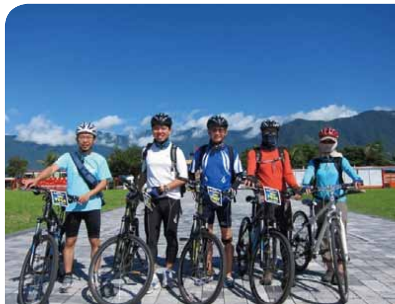
2012 與同事及學生花蓮鐵騎行（中間）。

對於學術研究，謝院長相當重視務實面與影響力，這多少基於個人的經歷。大學畢業那年考上律師和研究所，進修同時又執業，所以年紀輕輕就對當時司法生態有所理解。有一回「一位60多歲的當事人由於在訴訟過程中屢受挫折，一聽到我願意承接他的案子，當場跪倒在我面前感激涕零，讓我非常震驚，首次真切地感受到法律對老百姓的影響和重要」。他體認到律師只能幫助個案，助人有限，影響也有限，要讓法律更周全，造福大多數，就必須有學理作後盾，就這樣，他到德國讀博士，鑽研當時在國內尚不發達的智慧財產權法。