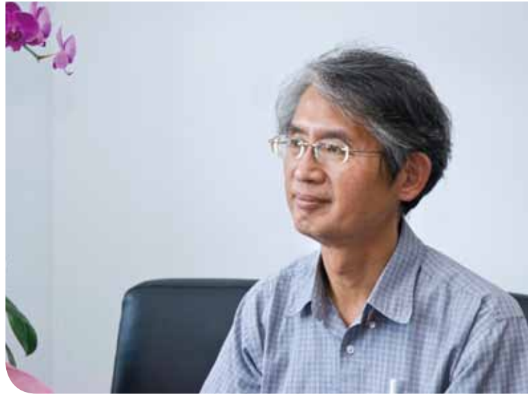
謝院長說真正的控球後衛，是要作球給隊友上籃得分，不是給自己。這是他對於院長的定位。

基於個人專長領域和產業界關係密切，謝院長甫上任即於10月底舉辦了一場國際盛會，邀請美國聯邦巡迴上訴法院院長、國際貿易委員會行