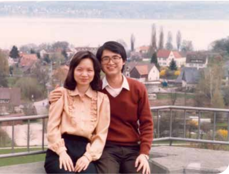
到德國攻讀智財權，當年冷門，現正得時。圖為1986年留學德國時與夫人合影。

的記錄，而且每個人都緊盯著前方的電腦螢幕校稿，使得案件審理過程毫無效率又不真實」。兩相比較，可知臺灣的司改之路還有很長的路要走。