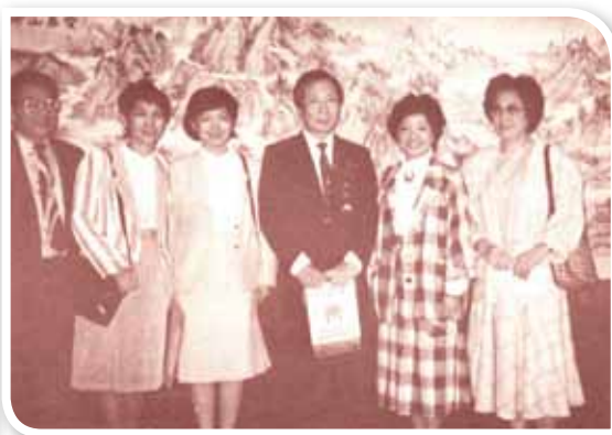
1998年，臺大菲律賓校友會組團返校，慶祝母校70週年校慶時，贈母校〈寶島山河圖〉，由前校長孫震接受。

說起來，我們還是比較幸運的。當年老師們上課時，經常鼓勵我們高中畢業之後到臺灣升學，學成返菲之後，可繼承他們傳播中華文化於海外的衣鉢。我就是在這種精神感召和大環境的影響之下，報名赴臺升學的。