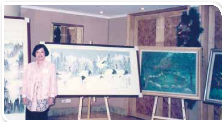
1996年，捐贈母校兩幅國畫義賣，籌募校務基金。