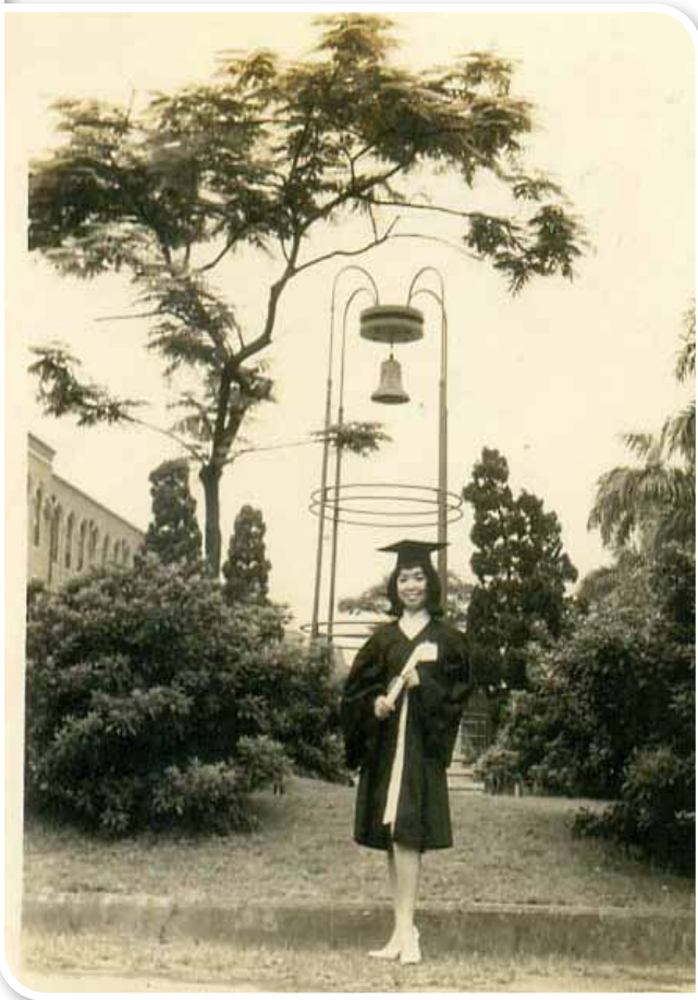
1965年，畢業典禮後，攝於「傳鐘」前。

公行鞠躬禮；寫作文寫到「蔣總統」時，前面一定要空一格，以表恭敬；老師更是嚴禁我們寫簡體字，違者重罰。這在現在臺、菲兩地的學生聽起來，都會感到匪夷所思，因為臺灣自從解嚴之後，政治開放，經過幾次政黨輪替、總統民選，對兩位前蔣總統已不再那麼尊崇。而菲律賓與中國建交之後，有一段時間因政治問題，實施軍統、禁止華人辦報，華文學校的課程更是被刪減到只剩下「華語」與「綜合」兩科。