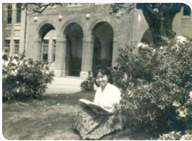
1963年，攝於臺大文學院杜鵑花叢前。

人一生的際遇，許多時候不是自己可以主宰或預先安排或規畫或控制的，會隨著大環境、時空與人事的輪轉而變動。所以，即使我們從小立下志願，長大後得出來的結果，卻往往不是當年所想。而我的志願是經過了一番折騰，到了最後，才又找回來的。