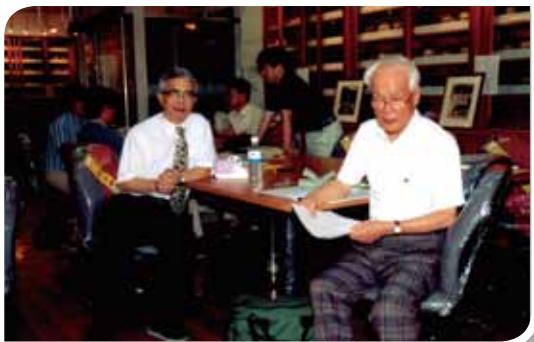
在前院長謝博生教授支持下，體質人類學研究室得以在2000年誕生。