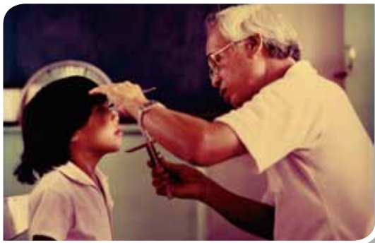
蔡錫圭教授於1980至1985年間以「先住民學童發育之研究」為題對阿美族（花蓮）、排灣族（屏東）、布農族（南投）6-15歲共4002名學童進行發育上的體質人類學研究。圖為1983年攝於屏東。