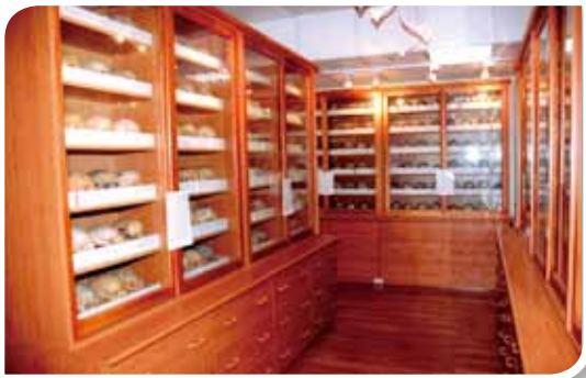
體質人類學研究室是研究臺灣人骨的寶庫。