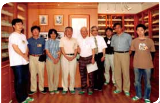
與日本東京大學、琉球大學組成共同研究團隊。