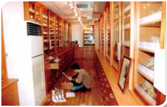
體質人類學研究室骨骼保存良好。