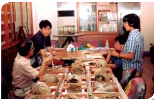
共同研究團隊在研究室專心討論。