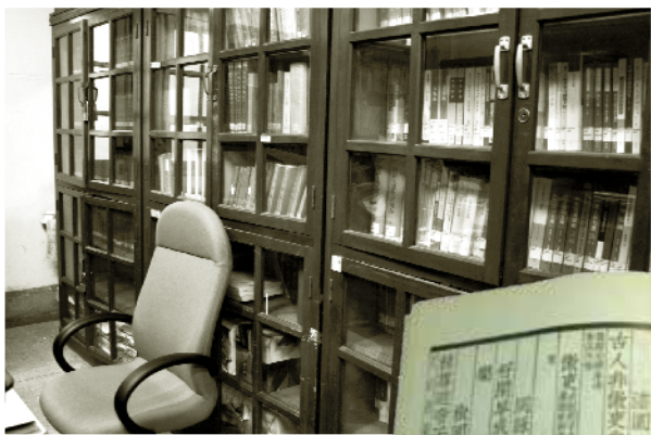
研究室書櫃，是教與學的膠卷。

坐在椅背或講桌上，看起來有些危險。他從未說明何以不好好坐在椅子上，在我的心目中卻正好呼應著《莊子》精神，隱然成為突破既定成見框架的象徵。