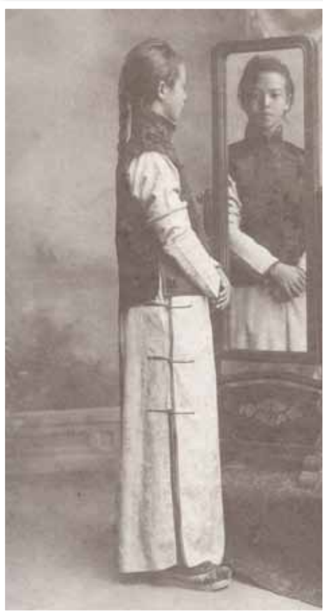
1911年，杜聰明於就讀醫學校時，落髮前的紀念照。時年19歲。