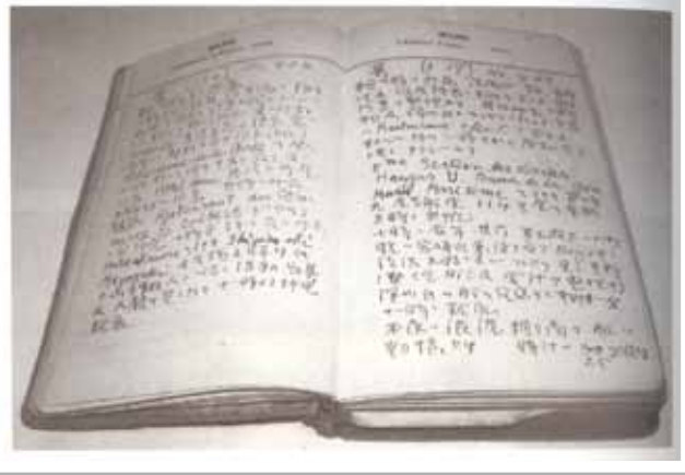
杜聰明博士第一次留學歐美（1928）之日記手稿。